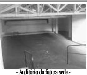
- Auditório da futura sede -